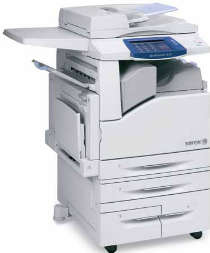
WorkCentre 7435 z powierzchnią roboczą, podwójnym zasobnikiem o dużej pojemności oraz zintegrowanym biurowym urządzeniem wykańczającym